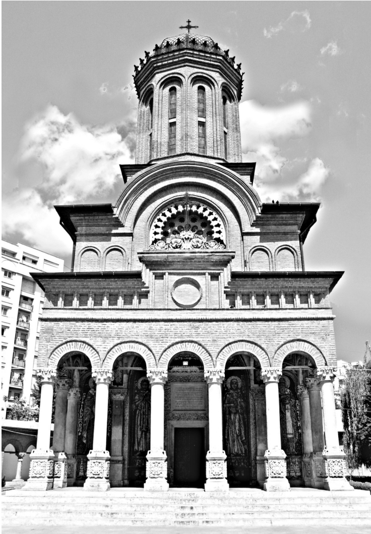
Mănăstirea Antim.